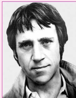
Владимир Высоцкий «Я не люблю»