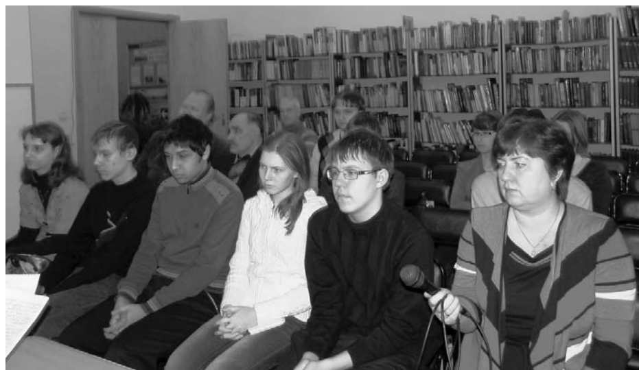
Во время конференции

«Примеры мужества и героизма русских солдат и офицеров будут жить в сердцах всех поколений, пока жива Россия! Они будут вдохновлять нас на ратные подвиги во имя Родины!» – к такому выводу пришли молодые участники Конференции.