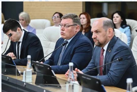
кто вернулся с фронта.

Кроме того, фракция активно продвигает проекты, связанные с поддержкой ветеранов, участвовавших в специальной военной операции. В 2024 году был принят закон, предусматривающий квотирование рабочих мест для ветеранов, что поможет им легче адаптироваться в гражданской жизни и найти стабильную работу. Этот закон стал важным элементом социальной политики области и поддержал тех,