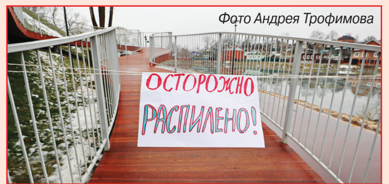
Фото Андрея Трофимова

Пресс-служба местного отделения партии в Сергиево-Посадском городском округе