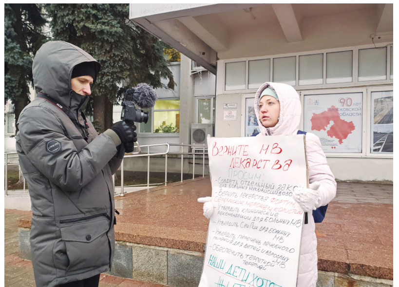
Пресс-служба местного отделения партии в Сергиево-Посадском городском округе