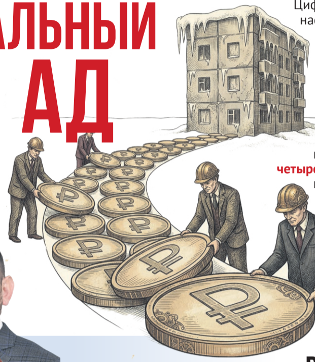
Иллюстрация: Алексей Беленев

В 2021 году правительство Московской области передало концессионерам коммунальное хозяйство – отопление и горячую воду – шести подмосковных муниципалитетов. Нас заверили, что это делается с благими намерениями и ради масштабной модернизации, но на деле вышла банальная «обдиризация» населения: трубы гниют как и прежде, а аппетиты концессионеров растут.