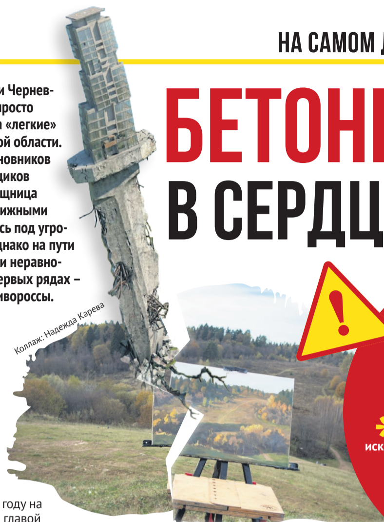
Коллаж: Надежда Карева

Смотрим на карту: зона застройки бетонным кинжалом пересекает русло Баньки и на километр с лишним уходит вглубь елово-широколиственного массива. Специалисты предупреждают: подобное вторжение нарушит биосферу всего леса. Шансов выжить не будет ни у птиц, ни у животных, ни у краснокнижных растений.