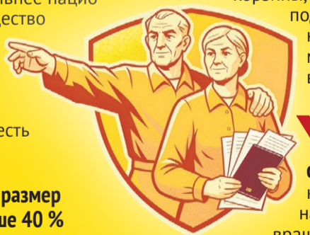
Иллюстрация: Алексей Беленев

В общем, доверять ли государству, решать по-прежнему каждый сам за себя. Но, выбирая конкретный пенсионный фонд, лучше, конечно, семь раз проверить и лишь потом один – доверить.