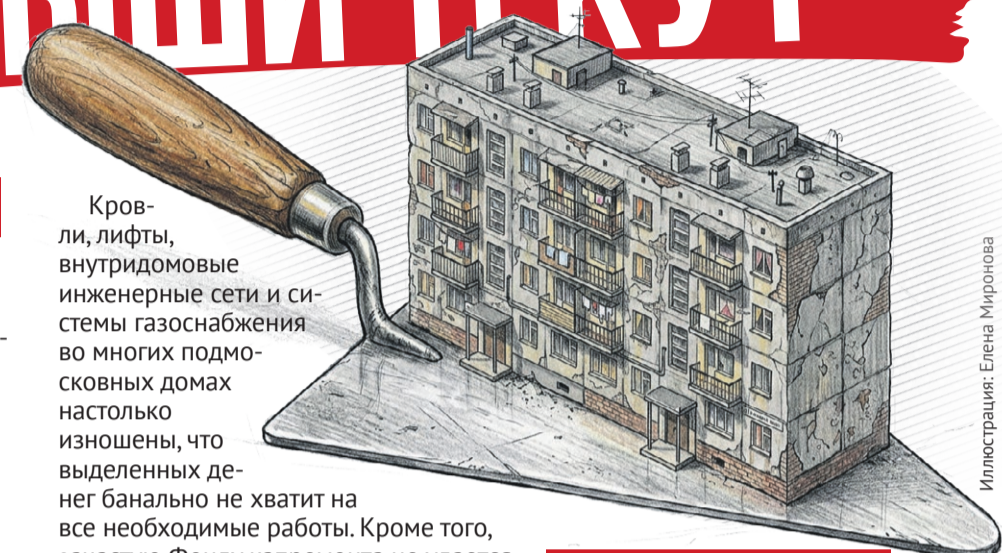
Иллюстрация: Елена Миронова

То есть за 12 лет ТАРИФ вырос более чем на 1 200 рублей в платежке! Квитанции в 2017 году – 6 100 рублей. В 2026 году – 8 750 рублей.