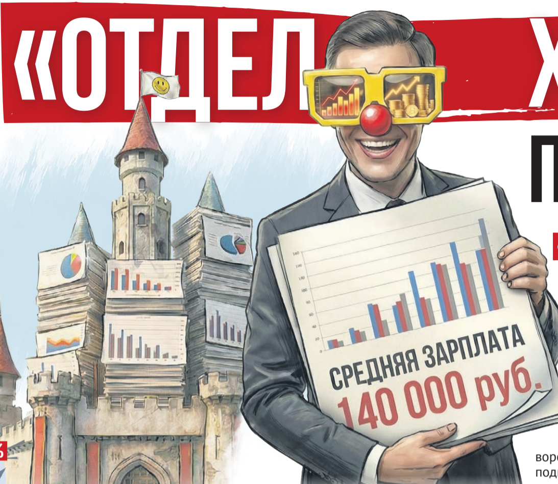
Иллюстрация: Алексей Беленев