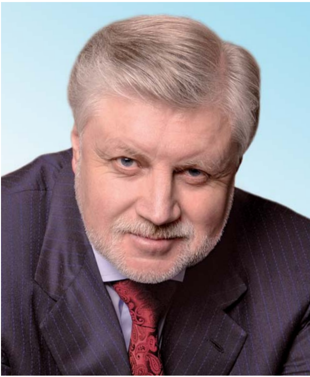
Сергей МИРОНОВ Председатель Партии СПРАВЕДЛИВАЯ РОССИЯ

легитимность, чем результат "Единой России". Есть позиция Президента, есть жесткая позиция ЦИКа, любая жалоба – выезжает группа и моментально наводит порядок.