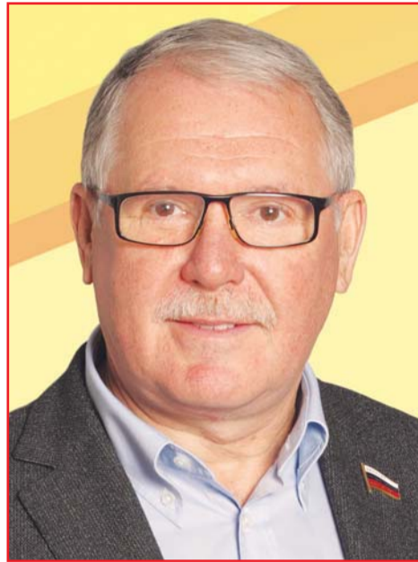
Александр РОМАНОВИЧ Заместитель председателя Государственной думы РФ, руководитель подмосковного отделения партии СПРАВЕДЛИВАЯ РОССИЯ