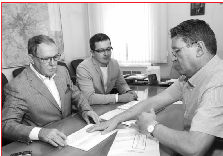
Во время сдачи документов