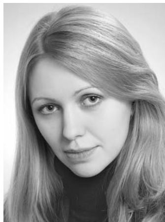
Александра САПИНА, депутат Московской областной Думы, член Комитета по вопросам государственной власти и региональной безопасности

Однако осенью нам предстоит вернуться к этому вопросу, так как сейчас в программу вошли только те дома, которые были признаны ветхими и аварийными до 1 января 2012 года. А что делать с теми, которые вошли в эту категорию позже, ведь в этих домах тоже живут люди?! Поэтому нам совместно с правительством Московской области, вероятно, необходимо будет вносить поправки и изменения в действующую программу».