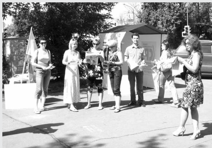
Активисты Партии СПРАВЕДЛИВАЯ РОССИЯ провели в Пушкино серию пикетов, чтобы привлечь внимание общественности к позиции Регионального отделения СПРАВЕДЛИВОЙ РОССИИ в Московской области по неправомерной многоэтажной застройке в городском поселении Пушкино.

СПРАВЕДЛИВАЯ РОССИЯ выступает против такого чисто коммерческого подхода к использованию городской территории. Партия исходит из того, что застройка многоэтажными зданиями участков в городе с уже давно сложившейся структурой и архитектурным обликом в значительной степени нарушает не только привычный уклад жизни большого числа жителей, но и противоречит градостроительным нормам в малых городах, идет вразрез с экологическими и санитарными требованиями.