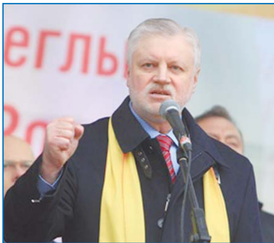
Сергей МИРОНОВ, Лидер Партии СПРАВЕДЛИВАЯ РОССИЯ, руководитель фракции «СПРАВЕДЛИВАЯ РОССИЯ» в Госдуме РФ

Более трех тысяч сторонников СПРАВЕДЛИВОЙ РОССИИ собрал 28 октября на Пушкинской площади в Москве митинг, посвященный пятилетнему юбилею со дня рождения Партии СПРАВЕДЛИВАЯ РОССИЯ. Выступая перед участниками митинга, лидер партии Сергей Миронов, в частности, сказал: