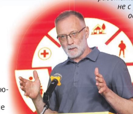
СЕРГЕЙ МИХЕЕВ

«Нужны те люди, которые действительно будут защищать собственную страну. Это во-первых. Во-вторых, оправдывать все деньгами просто невозможно, потому что тогда можно продать все за деньги. В-третьих, есть одна настоящая проблема — мы готовы работать с кем угодно, только не с русскими, которые остались за пределами страны. Но это же какой-то совершенно ненормальный парадокс!» — возмутился Сергей Михеев .